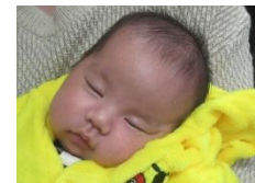
ひがしおんな みなとさん